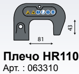
Плечо HR110 Арт. : 063310