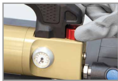
Настройка давления от 0 > 6.5 бар