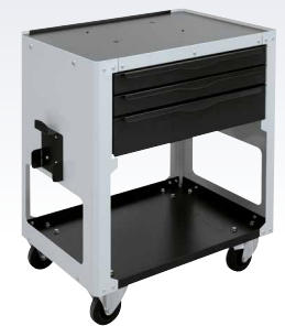
тележка GYPRESS 8T Арт. 054233